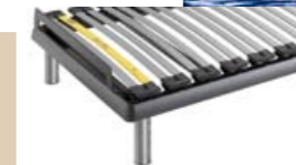
bed op pootjes