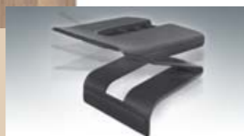
verend van rand tot rand

Uniek is het nieuwe hardheidsregulerings systeem, dat eerst de lat verstevigt zonder haar flexibiliteit te blokkeren. Daarmee biedt het Bicoflex lattenbodempogramma veelzijdige verstelbaarheid om de heupen daar waar nodig de gewenste ondersteuning te geven. De instelling kan op eenvoudige wijze en zonder gereedschap gebeuren en is altijd weer wijzigbaar.