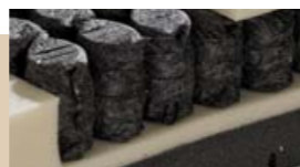
pocketveer in heupzone