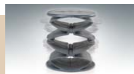
kunststof veerelement in schouderzone