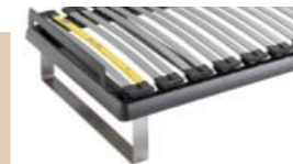
bed op glijders